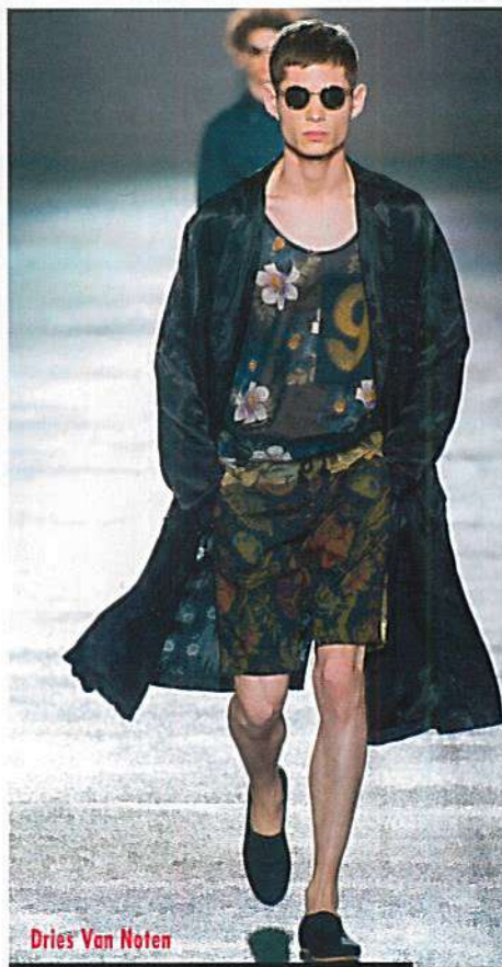
Dries Van Noten